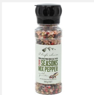
ソルト & ミックスペッパー ミル付き 180g

PRODUCT CODE: MIXP SIZE: L:5 x H:16.5 cm JAN: 9339337003158 BOX QTY: 12 PC/CTN