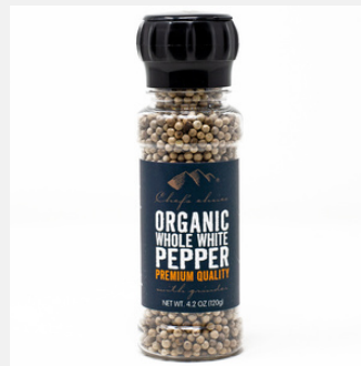
有機ホワイトペッパー ミル付き 100g

PRODUCT CODE: WPEP SIZE: L:5 x H:16.5 cm JAN: 9339337307614 BOX QTY: 12 PC/CTN