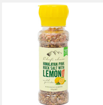
レモンゼスト シーズニング ミル付き 150g

PRODUCT CODE: LEMON SIZE: L:5 x H:16.5 cm JAN: 9339337004124 BOX QTY: 12 PC/CTN