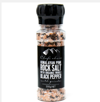
ソルト & 有機ブラック ペッパー ミル付き 200g

PRODUCT CODE: H2X SIZE: L:5 x H:16.5 cm JAN: 9339337002007 BOX QTY: 12 PC/CTN