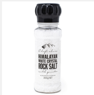
ヒマラヤホワイト岩塩 ミル付き 200g

PRODUCT CODE: HW1 SIZE: L:5 x H:16.5 cm JAN: 93393370000492 BOX QTY: 12 PC/CTN