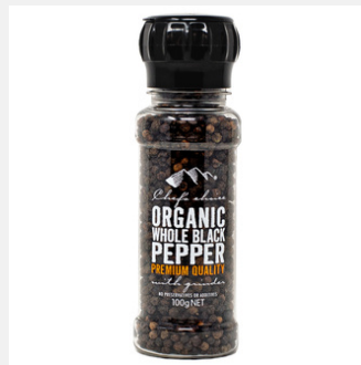
有機ブラックペッパー ミル付き 100g

PRODUCT CODE: AKV SIZE: L:5 x H:16.5 cm JAN: 9339337002014 BOX QTY: 12 PC/CTN