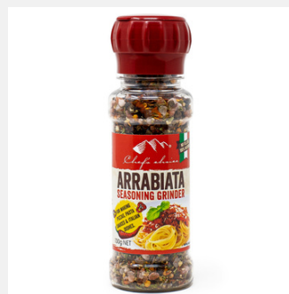
アラビアータ シーズニング ミル付き 130g

PRODUCT CODE: ARABIATTA SIZE: L:5 x H:16.5 cm JAN: 9339337008221 BOX QTY: 12 PC/CTN