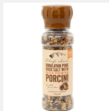
ボルチーニ シーズニング ミル付き 140g

PRODUCT CODE: POR SIZE: L:5 x H:16.5 cm JAN: 9339337004148 BOX QTY: 12 PC/CTN