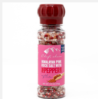
ソルト & ピンクペッパー ミル付き 170g

PRODUCT CODE: PINKP SIZE: L:5 x H:16.5 cm JAN: 9339337007522 BOX QTY: 12 PC/CTN