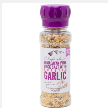
ローストガーリック シーズニ ング ミル付き 160g

PRODUCT CODE: GARLIC SIZE: L:5 x H:16.5 cm JAN: 9339337004131 BOX QTY: 12 PC/CTN