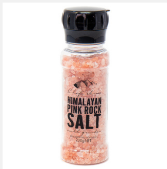
ヒマラヤピンク岩塩 ミル付き 200g

PRODUCT CODE: TD SIZE: L:5 x H:16.5 cm JAN: 9339337000096 BOX QTY: 12 PC/CTN